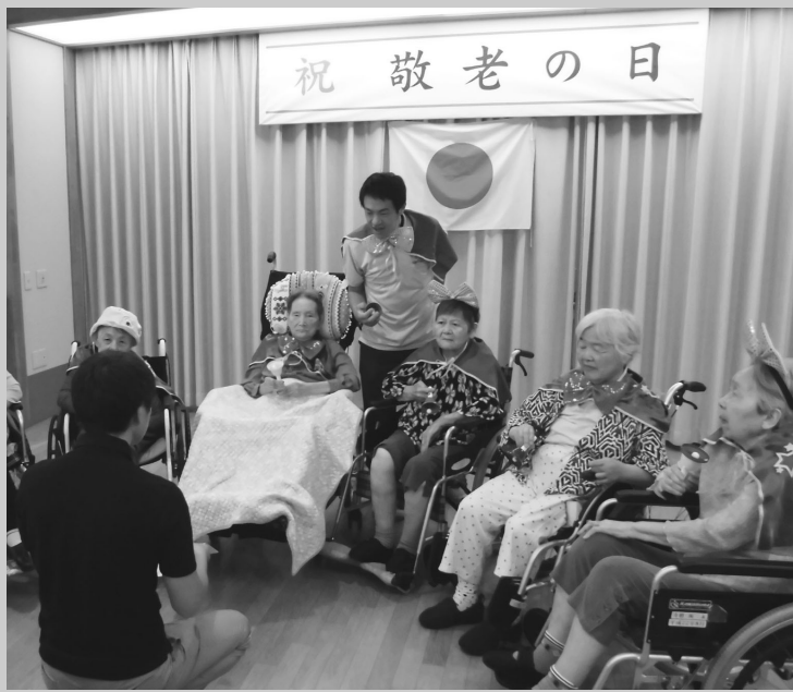
敬老の日 ハンドベル演奏

ますます進展する社会の高齢化の現実の中、現在の発想のまま未来を見据えるのであれば、介護現場の未来像は少し暗いイメージとなります。団塊世代の高齢化に伴って生じる高齢者人口及び要介護高齢者の増加、社会全体で進む人口減少や労働力減少、それに伴う経済成長の低下、さらには家族意識や家族のあり方の変化等、これまでの延長で考えるのであれば、これからの高齢者介護をめぐる状況は厳しくなる一方だと言えます。しかし、物は考えようであり、よく言われるようにピンチはチャンスでもあります。 現在、政府は介護現場での労働軽減と産業全体の新たな技術革新を進めていくためにも、介護ロボットの導入を奨励しています。旭川敬老園においても、今年度、国の予算を活用した岡山市の補助金を受け、サイバーダイン社の「HAL」という腰回りに装着する介護支援用ロボットを導入することとしました。ロボットといっても、何も職員に代わって介護を行うわけではありません。HALが職員の力をアシスト(補助)することで、職員の労働負荷が軽減されるといったタイプのものです。いわば、電動アシスト自転車と同じような考え方で理解すればよいのですが、その原理は装着した職員の脳から発する生体電位信号を読み取り、職員自身が動かそうとする身体の手助けしていくといった、最先端科学の知見に基づくロボット型の機器です。 介護の仕事というと、どうしても人力に頼ったイメージが強く、科学や産業発展とはやや縁遠いように思われがちですが、科学知識や産業技術の進展といったことも大きな影響を持っています。たとえば、介護用の紙オムツが普及したのは今から二十数年前ですが、介護現場のあり方はこれで一変しました。また、近年では栄養補助食品等の種類や品質が急速に進化、発展し、低栄養状態にある者や嚥下状態の悪化した者の栄養改善に大きく寄与しています。 今後、確実にわが国の高齢化が進展していくからこそ、介護分野においても最先端の科学知識や科学技術の活用が期待されています。また、そうしたことの積み重ねが介護現場の労働軽減と共に、介護の仕事のイメージアップにもつながっていくものだと思います。高齢者介護の未来を明るくしていくためにも、これから様々な介護関連の技術開発や製品開発が進展していくことを期待しています。